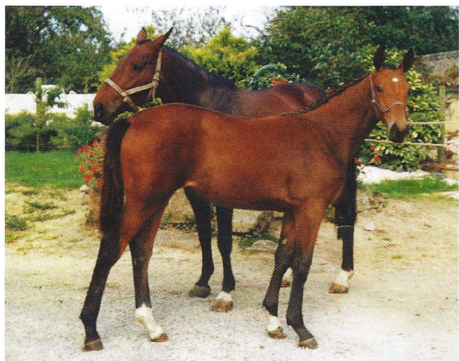
Venise des Cresles, op deze foto als veulen met haar moeder Miss des Cresles. Tijdens de geboorte van haar enige veulen Diamant de Semilly stierf Venise op vierjarige leeftijd.

Desondanks lieten de fokkers hem aan het eind van zijn loopbaan een beetje in de steek vanwege het feit dat hij nogal groot en hoogbenig fokte.